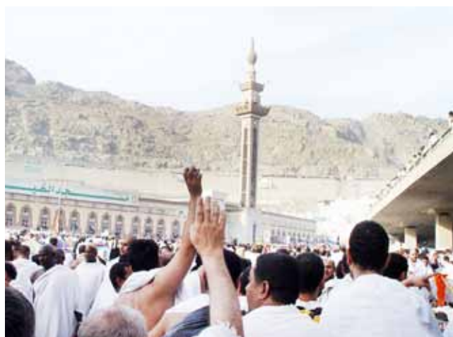
منی - مسجد خیف